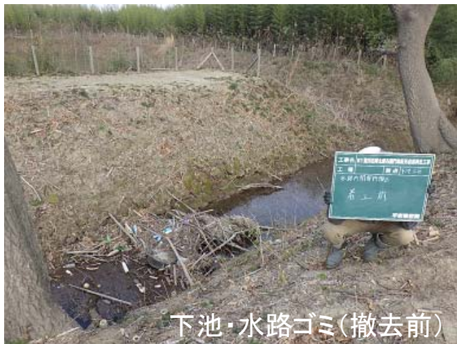
下池・水路ゴミ(撤去前)