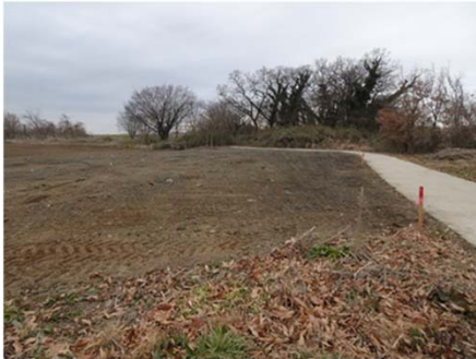
トウグワ・クズ伐採・抜根箇所