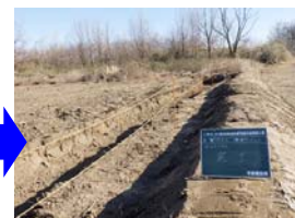
トウグワ伐採・除根、クヌギ伐採箇所