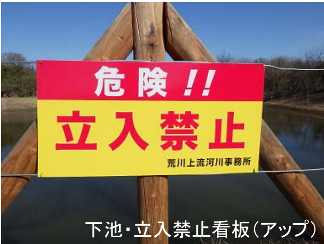
下池・立入禁止看板(アップ)