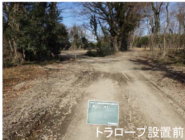
トラロープ設置前