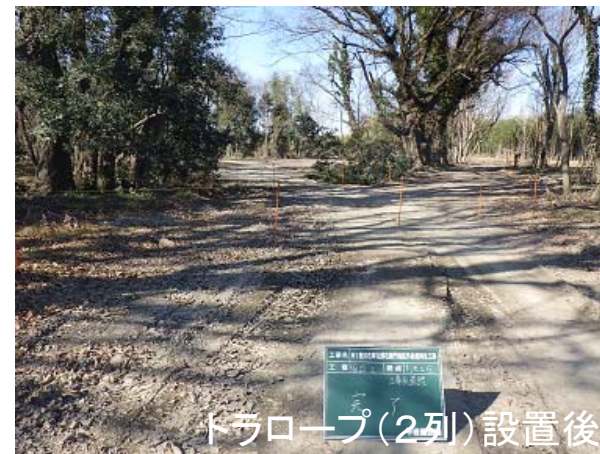
トラロープ(2列)設置後