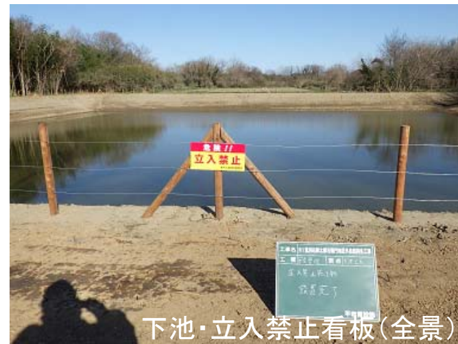
下池・立入禁止看板(全景)