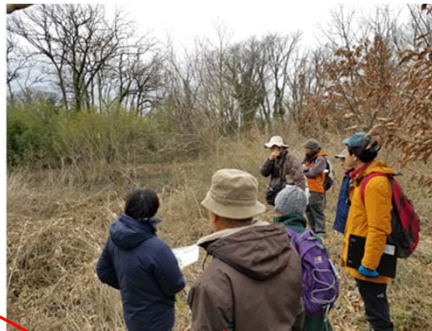
サクラソウ移植候補地（中池）