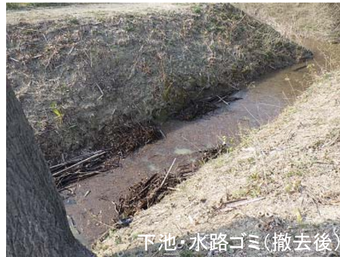
下池・水路ゴミ(撤去後)