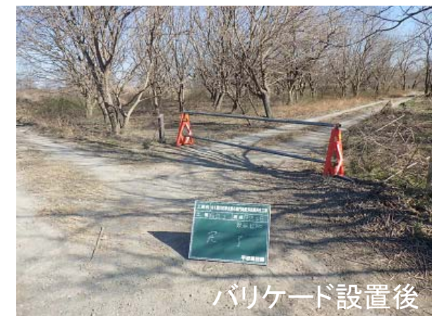
バリケード設置後