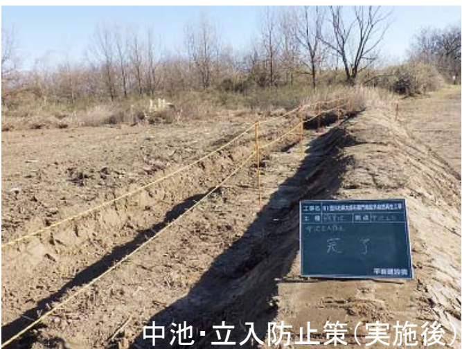
中池・立入防止策(実施後)