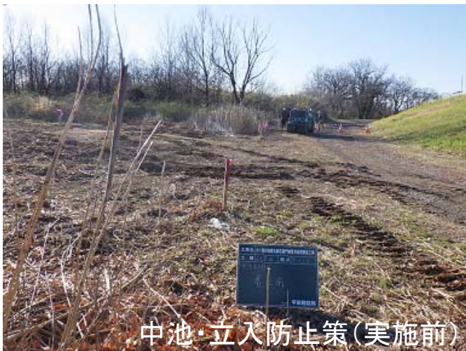
中池・立入防止策(実施前)