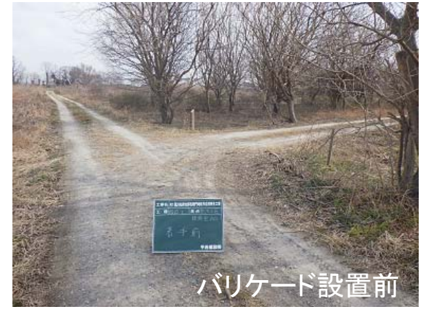
バリケード設置前