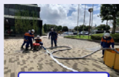
可搬ポンプ操作訓練