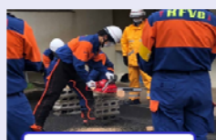
チェーンソー操作訓練