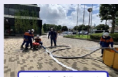
可搬ポンプ操作訓練