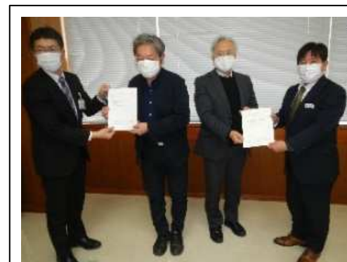
アドバイザー委嘱状況