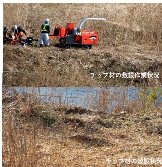
チップ材の敷設作業状況

本報は鶴見川 高水敷樹木伐採作業についてです。これまで伐採作業で出た伐採ごみにつき、現地から当然に撤去すべきもので、処分に費用が掛かるため、河川管理者としてペレット化であるとかいろいろトライして苦労されていた印象があります。1月29日に伐採作業を見ていると、伐採した木を破砕機に入れて破砕し、破砕くずを高水敷にまき散らしていました。ゴミを持ち込んだ訳では無く、また現地の高水敷はかなり高さがあるため、よほどの出水でなければ流出の可能性は低く、特段の問題は無いのかも知れませんが、破砕くずは数センチ角でかなり大きく、生木なので分解には数年以上を要する感じでこれを高水敷に敷き詰めて問題無いのでしょうか。【いつも、御報告ありがとうございます。伐採樹木は、チップ化したうえで付近に敷き均しています。当該地は、樹木や雑草で覆われていることから、現地に繁茂している樹木を有効利用し、チップ材として敷設することにより、樹木や雑草の繁茂を抑制する取り組みを試験的に実施しているものです。今後ともよろしくお願いいたします。】