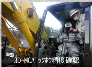
3D-MCバックホウ精度確認