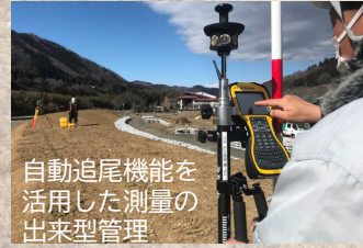
自動追尾機能を活用した測量の出来型管理

働くまで3kが気になっていましたが、当現場は、ICT活用や快適トイレなど労働環境が快適です。建設業は、新3kといって、給料が良く、休暇が取れて、希望が持てると思ひますので、選択肢の一つにして頂ければと思ひます。