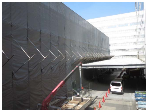
外壁改修用の枠組み足場