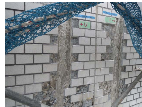
タイルひび割れ改修状況