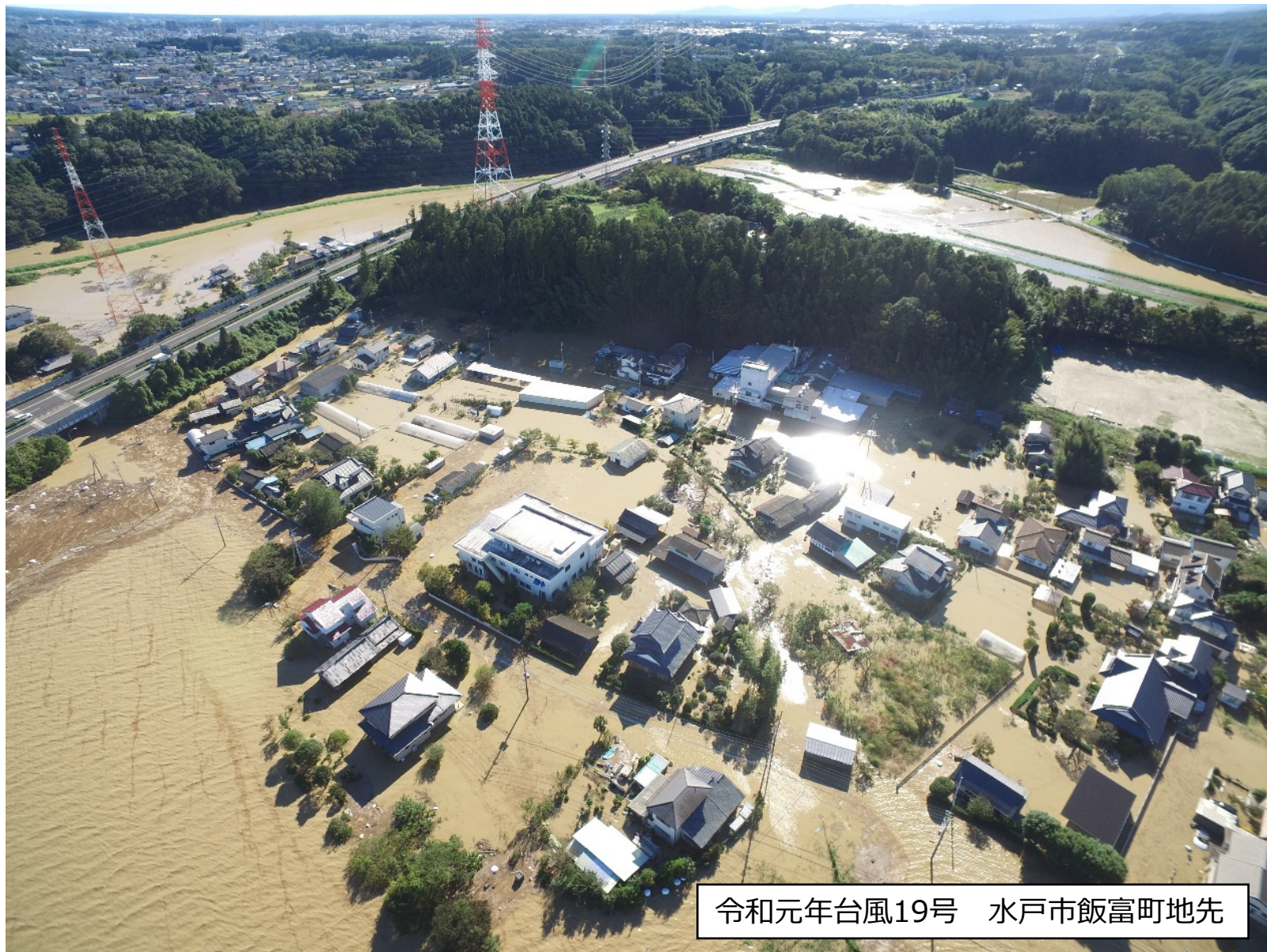
令和元年台風19号 水戸市飯富町地先