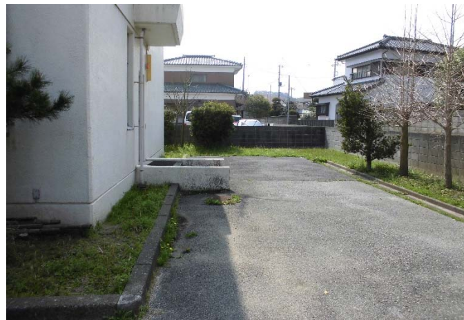
▲⑦庁舎東側 現場事務所設置箇所周囲