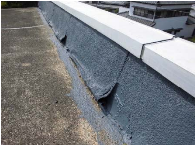
▲③屋上防水 立上り部状況