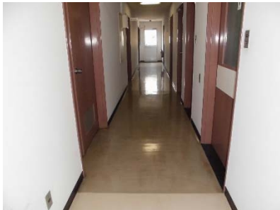
▲⑥搬入経路・内装 1階廊下状況 (W=1,340)