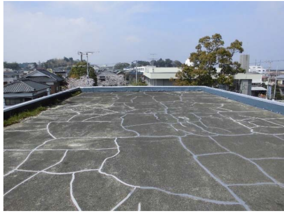
▲②屋上防水 平場状況 (M4ASI 工法)