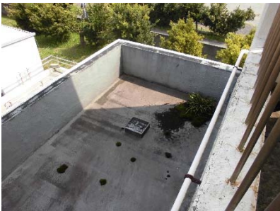
▲⑤庇防水 状況 (L4X 工法)