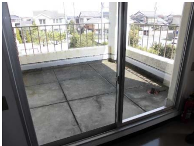
▲④バルコニー 状況 (POAS 工法)