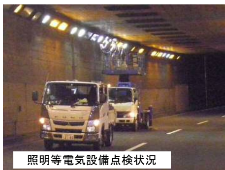
照明等電気設備点検状況