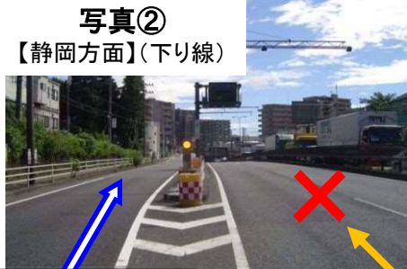
迂回路 (国道246号側道) 国道246号 (下鶴間トンネル 静岡方面)

※国道246号の下鶴間トンネルは通行止に伴い、国道246号の側道を迂回路として利用願います。