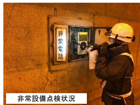
非常設備点検状況