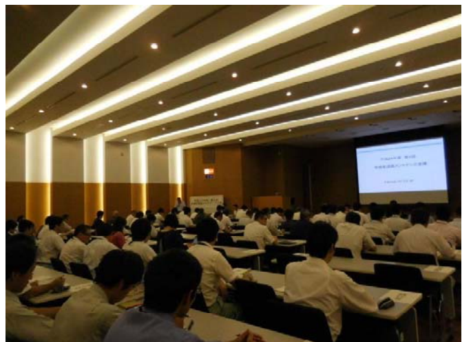
【平成28年度第1回会議の開催状況(7/15)】