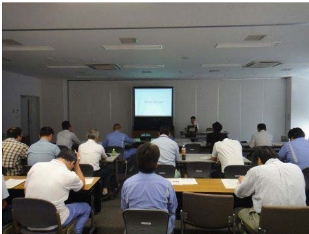
橋梁点検に関する知識を習得する ための座学状況

関東地方整備局では、平成28年度から一部の橋梁について職員自らが行う直営点検・診断を試行している。