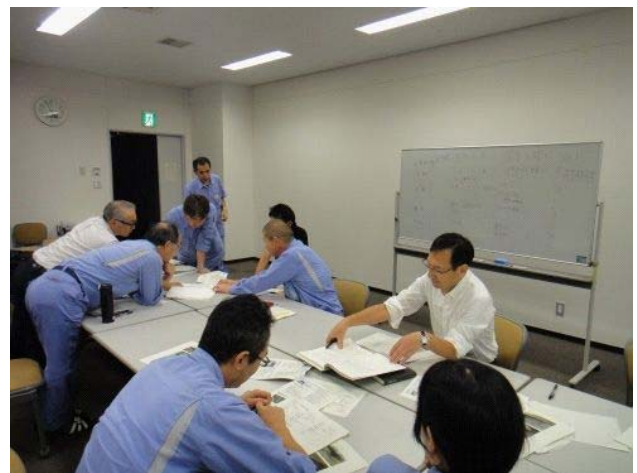
点検結果に基づく診断状況