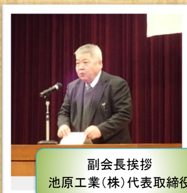
副会長挨拶 池原工業(株)代表取締役