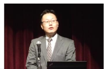
【講話】労働災害防止と働き方改革 群馬労働局 産業安全専門官