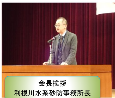
会長挨拶 利根川水系砂防事務所長

利根川水系砂防安全対策協議会では、建設労働災害の発生を防止し、かつ労働者の安全衛生及び職場環境の向上に努めることを目的とした協議会会員の情報供給の場として総会を年2回開催しています。11月27日に北橋公民館で開催し、164名が参加しました。