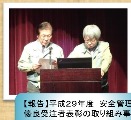
【報告】平成29年度 安全管理優良受注者表彰の取り組み事例 池下工業(株)