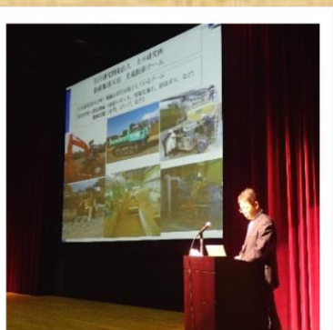
【講話】無人化施工について一概要説明と最近の土木研究所の研究一 国立研究開発法人 土木研究所 主任研究員