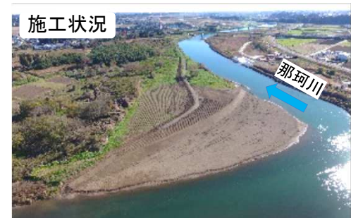
(令和2年11月撮影(河道掘削完了))