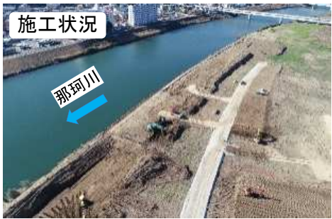
(令和2年12月撮影(河道掘削中))