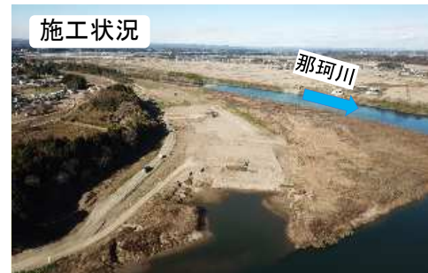
(令和2年12月撮影(河道掘削中))