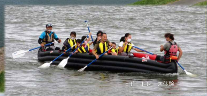
Eボートレース体験