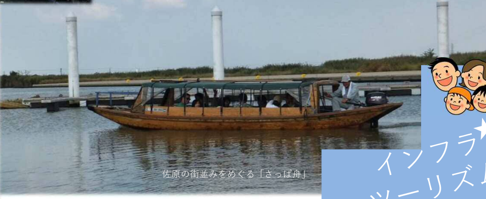
佐原の街並みをめぐる「さっぱ舟」