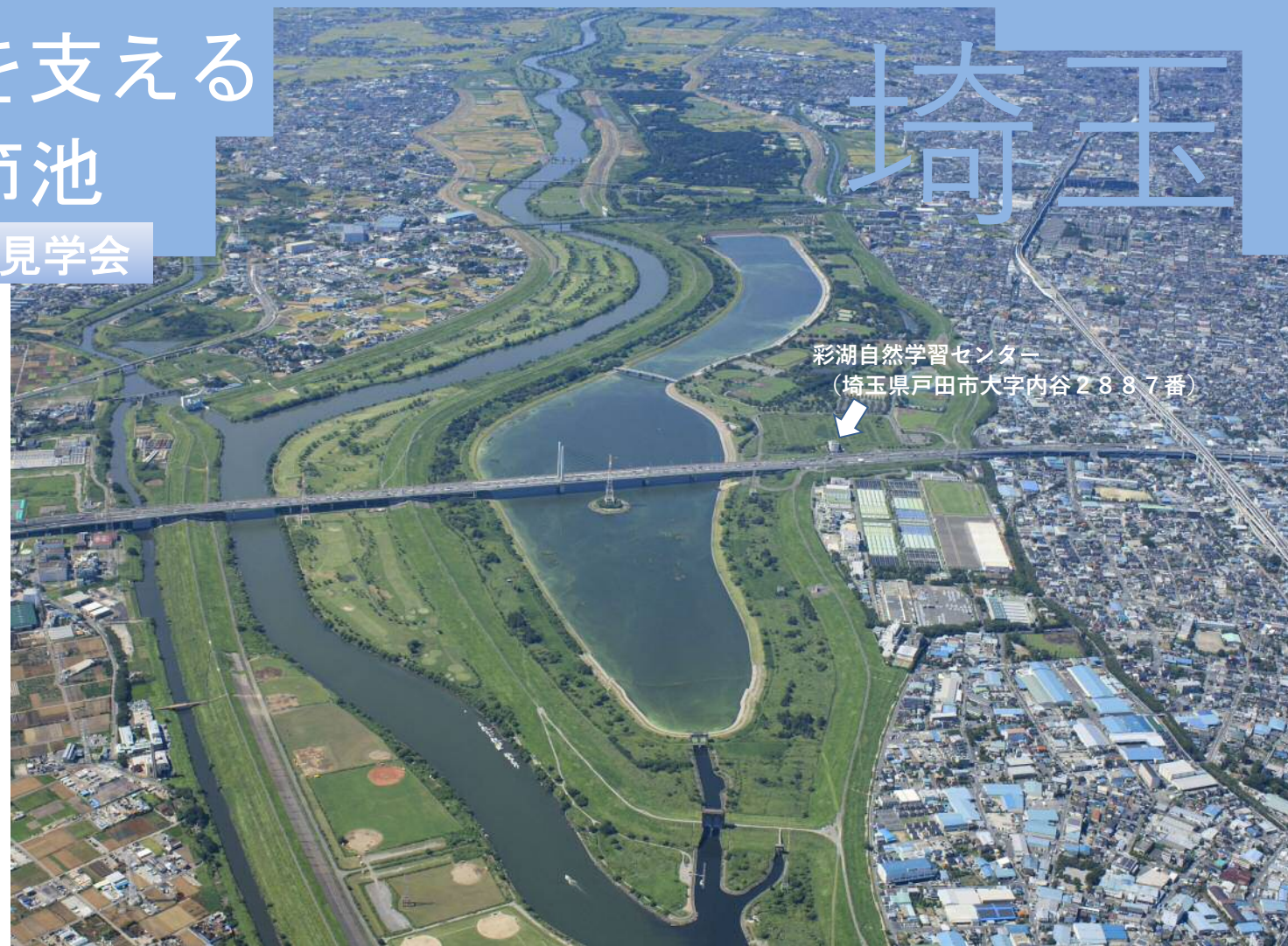
彩湖自然学習センター (埼玉県戸田市大字内谷2887番)