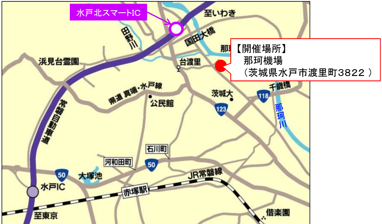
開催場所の詳細図