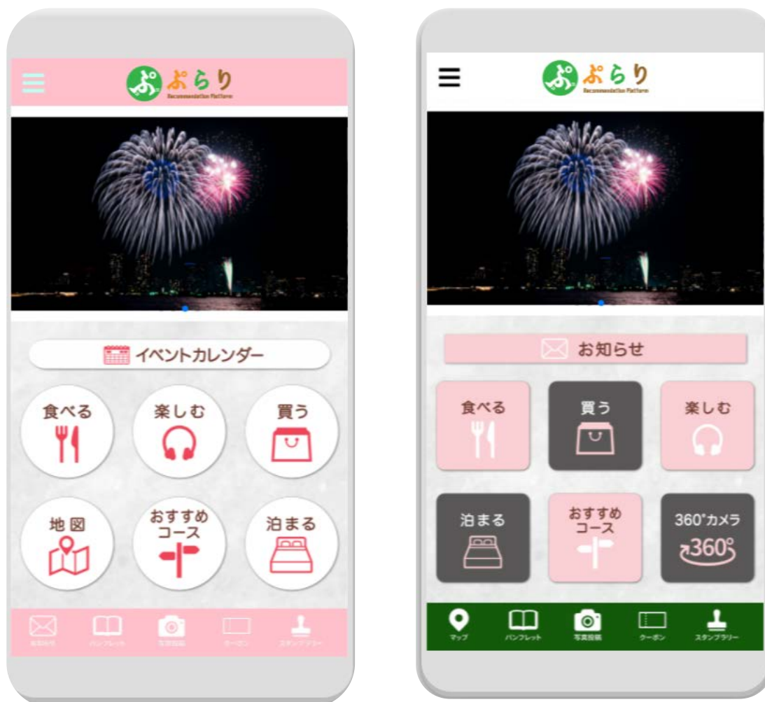
アプリのイメージ