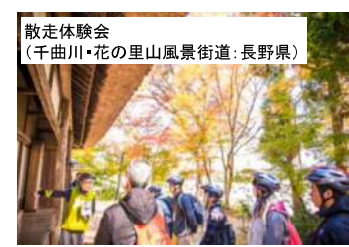
散走体験会 (千曲川・花の里山風景街道:長野県)