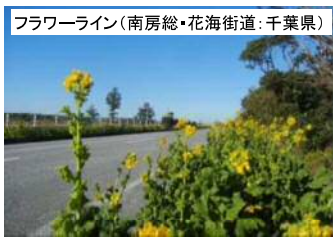
フラワーライン(南房総・花海街道:千葉県)

[ホームページアドレス https://www.mlit.go.jp/road/sisaku/fukeikaidou/ ]