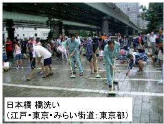
日本橋 橋洗い (江戸・東京・みらい街道:東京都)