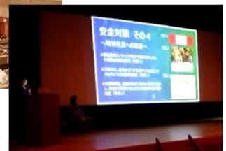
受注者による発表状況