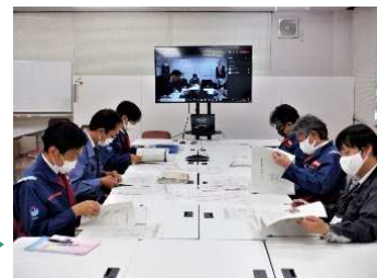
築堤詳細設計の打合せ (WEB) ▶