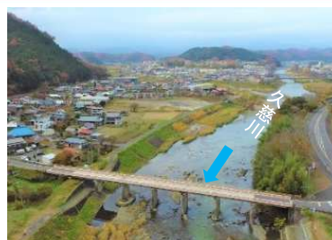
◀ドローンによる調査 (大子町)

ドローンによる調査や現地調査による立ち入り等について、引き続き地域のみな様のご協力をお願いします。