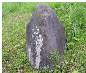
①明治23年洪水被害記念碑