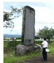
④久慈川改修記念碑