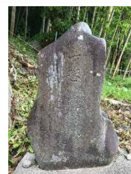
②可恐（おそるべし） （久野瀬）