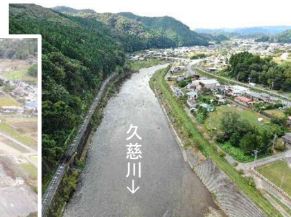
大子町北田気地区