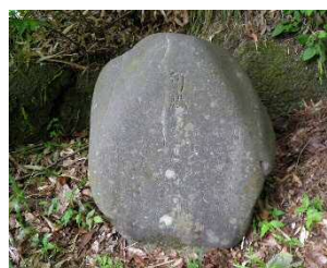
③可恐（おそるべし）（袋田）