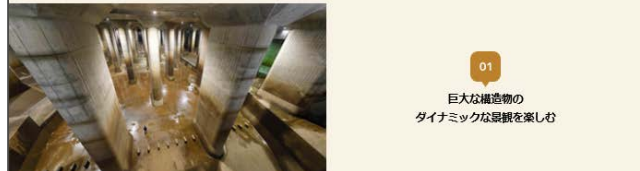
01 巨大な建造物のダイナミックな景観を楽しむ

インフラツーリズムでは、「巨大な建造物のダイナミックな景観を楽しんだり」、「普段は入れないインフラの内部や今まで見られない工事風景など平日の体験を味わう」ことができます。また、カイドの案内を聞いた後、展示物を見て回ることで、「インフラ施設の設計やつくられた背景を学ぶ」ことができます。地域と連携した企画に参加することで「インフラ施設周辺の観光資源を高める」のもインフラツーリズムの魅力です。