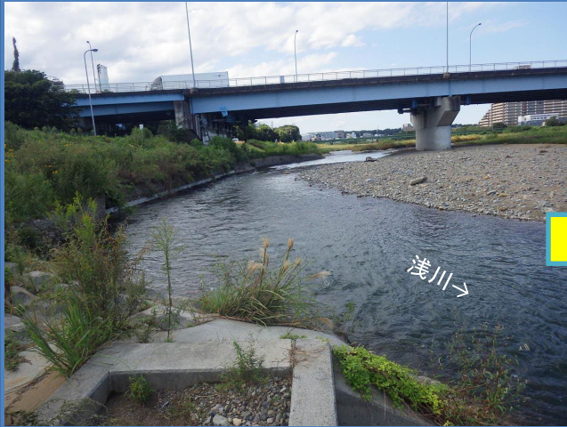
工事着手前(令和元年9月撮影)