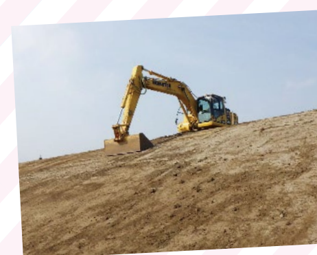
【ICT建機による法面整形】