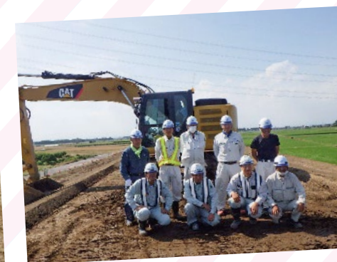
【ICT土工に従事した熟練技術者】