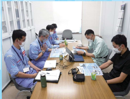
調査後の打ち合わせの様子