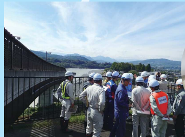
台風19号被害における災害派遣の様子（令和元年10月長野県東御市内）