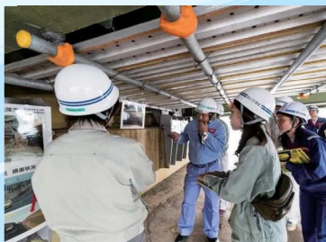
研修の様子（左：令和元年10月千葉県柏市内 ※関東地方整備局主催 右：令和元年8月東京都青梅市内 ※地方公共団体主催）

関東道路メンテナンスセンターでは、上記技術相談の他にも、地方公共団体向けの研修や講義の講師を務めています。また、災害支援としての職員派遣や、緊急かつ高度な技術力を要する可能性が高い橋梁を対象とした、直轄診断を実施しています。老朽化する道路や橋梁を抱えてお困りの自治体の皆さまは、お問い合わせください。