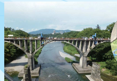
直轄診断の様子（令和元年8月埼玉県秩父市内）