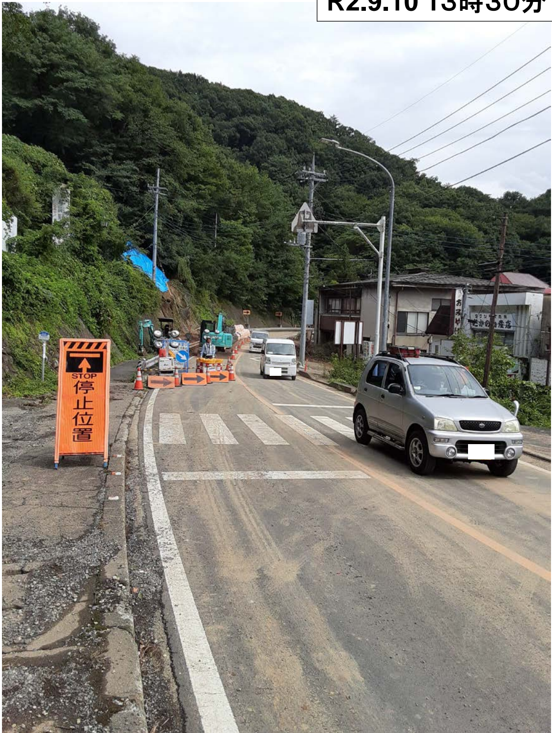
写真:片側交互通行状況(新潟側から高崎市方向を望む)