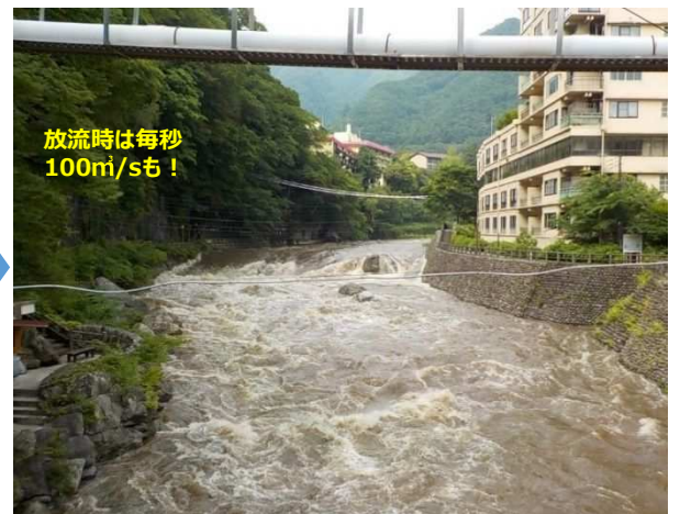
川治温泉街（薬師橋付近）