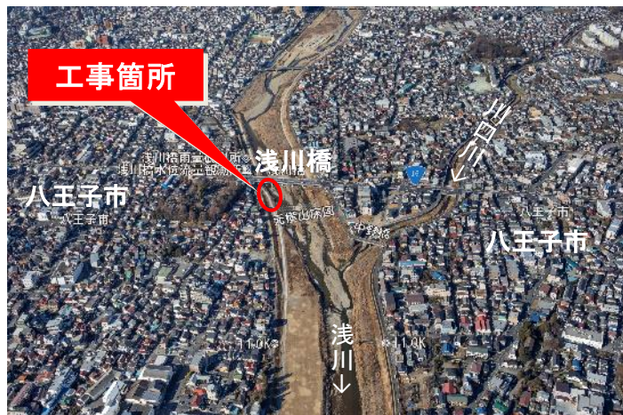
現在(令和3年3月撮影)