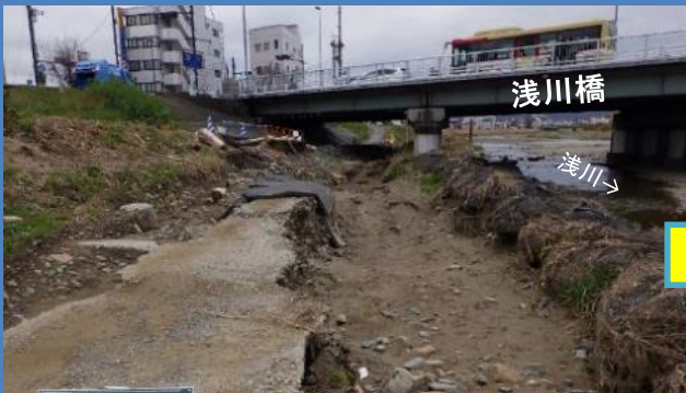
工事着手前(令和元年10月撮影)