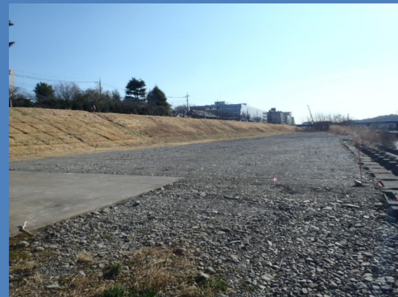
住吉町地先 (令和3年2月撮影)