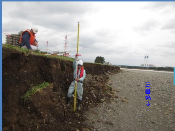
工事着手前（令和元年10月撮影）