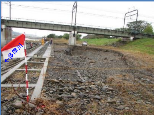
工事着手前（令和元年10月撮影）