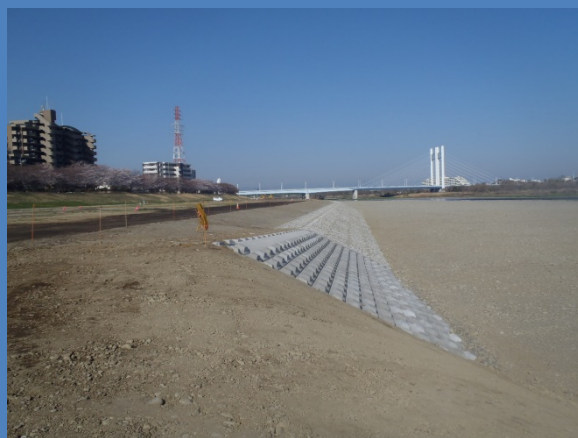
大丸地先 (令和3年3月撮影)