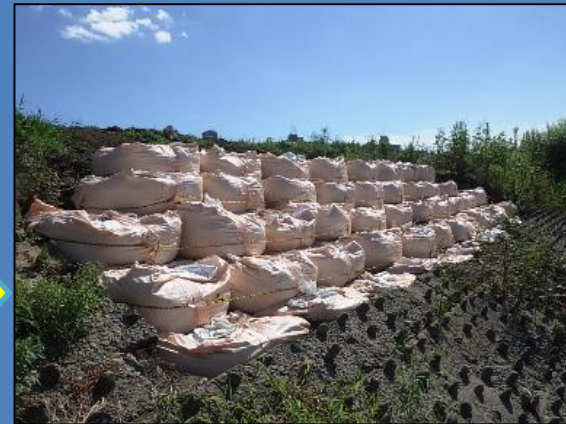
仮復旧が完了しました。