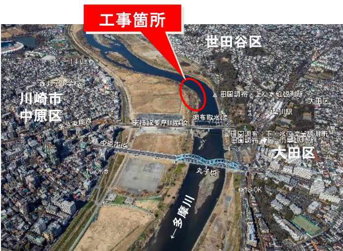
工事着手前(令和元年11月撮影)