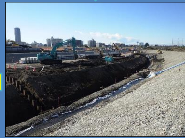
護岸ブロックを設置しています。