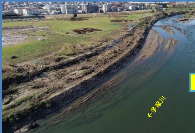
工事着手前(令和元年11月撮影)