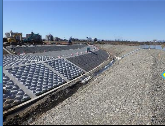
引き続き、護岸ブロックを設置しています。