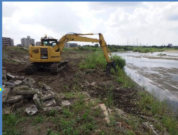
写真は仮復旧の作業状況です。