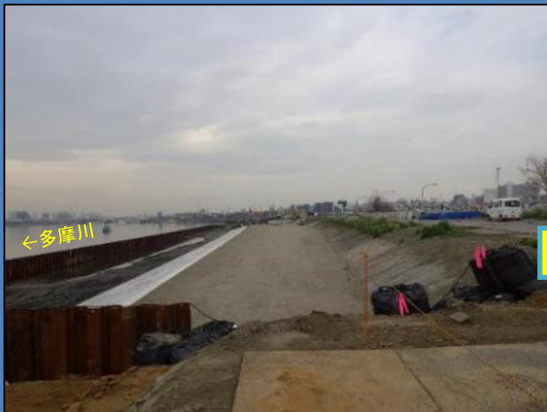
工事着手前(令和2年3月撮影)