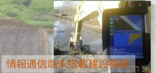
情報通信端末搭載建設機械