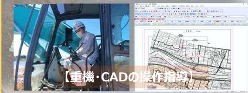
【重機・CADの操作指導】