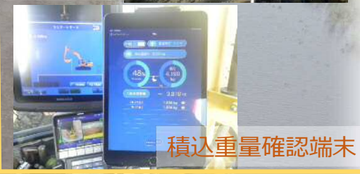
積込重量確認端末