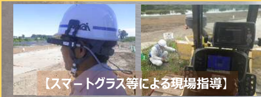
【スマートグラス等による現場指導】