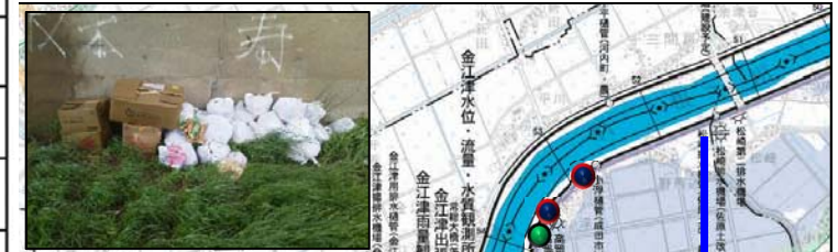
各出張所のゴミの割合