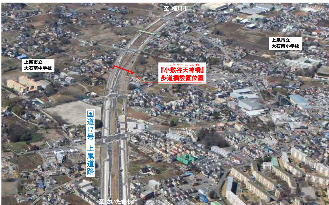
国道17号上尾道路（上尾市小敷谷地先） ・歩道橋設置位置空撮 H31.3 撮影

上尾市小敷谷地先には、その昔「天神池」がありました。そこは、弘法大師が腰掛けたとの言い伝えが伝承されており、いまでは、近隣住民の皆様が祠を建立し、地域の安全と発展が祈願されています。この「天神」にちなみ、交通安全を担う横断歩道橋の名称に相応しく採用となりました。