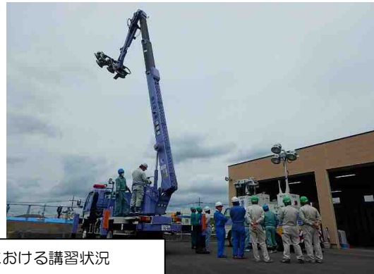
R1年度の同講習会における講習状況