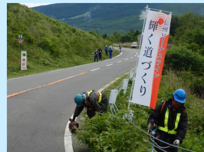
沿線の環境整備活動