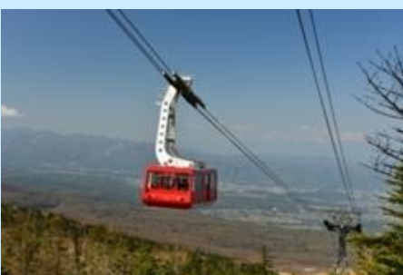
北八ヶ岳ロープウェイ