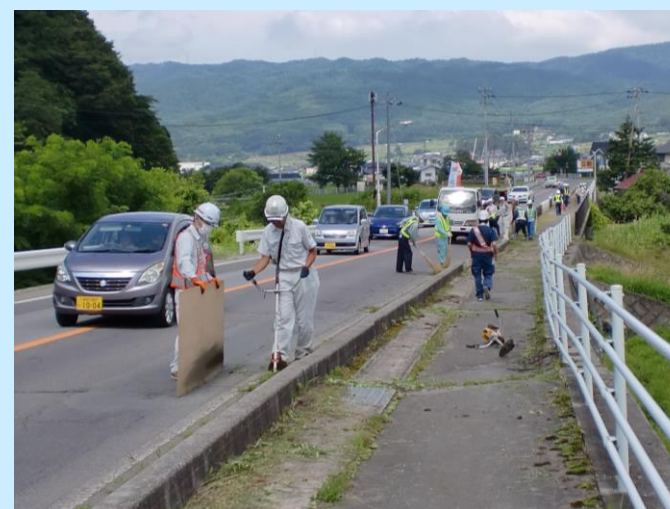
沿線の環境整備活動