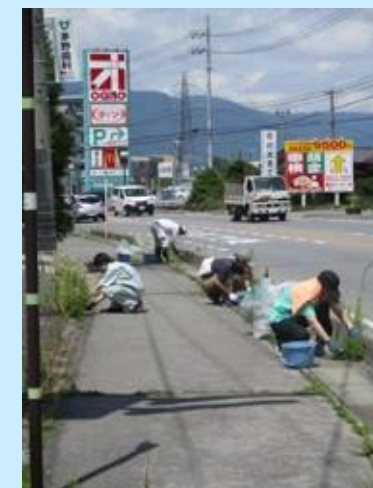
沿線の環境整備活動