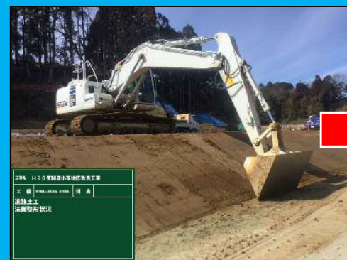
3DMCバックホウによる 法面整形