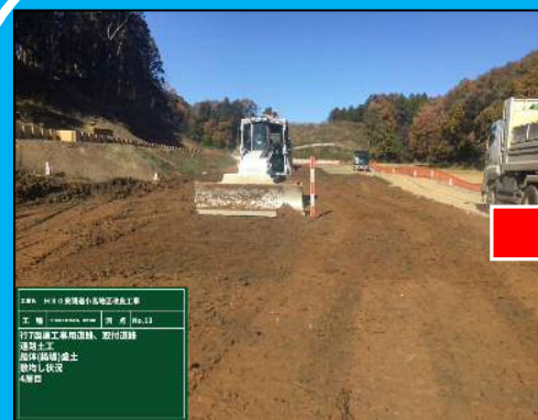
3DMCブルドーザによる敷均し