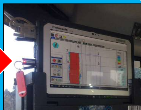
色で転圧回数を管理