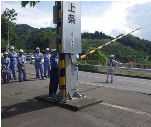
片側交互通行規制実施状況