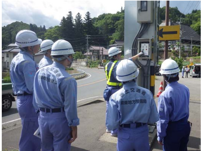
職員が大雨災害に備え 遮断機の操作方法を確認