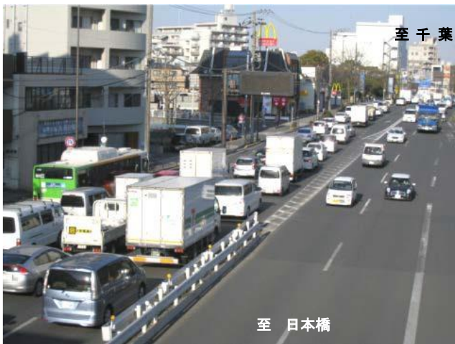
ひがしこまつがわ 東小松川交差点付近