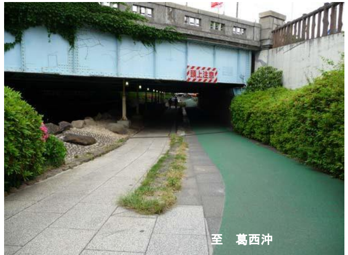
さかいがわ 境川橋