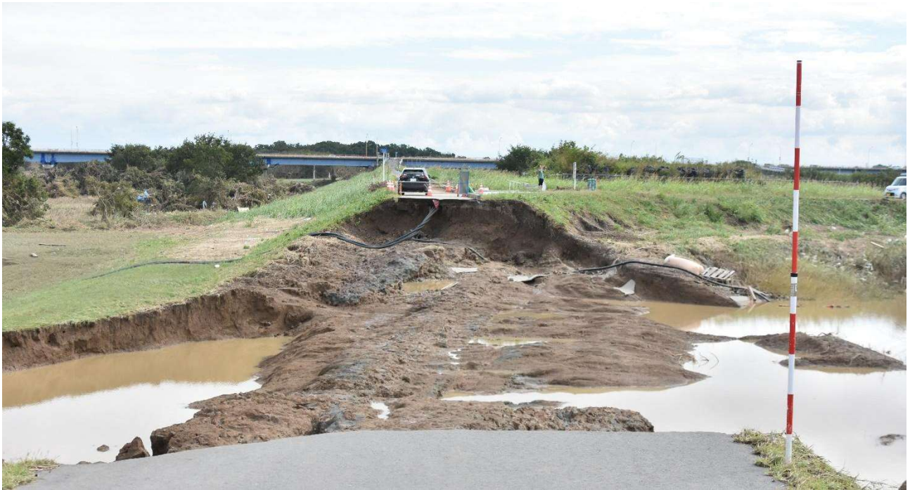
令和元年10月 越辺川堤防決壊箇所（川越市大字平塚新田地内）