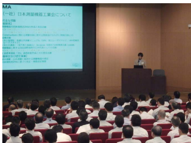
写－6 出展技術発表会

建設技術の活用・普及促進を図ることを目的として、建設技術展示館に出展している技術を行政・民間の技術者に出展者自らが紹介するもので、第14期は12回（年間6回）の開催を予定しており、継続教育CPD及びCPDSの認定を受けています。（写－6、表－1）