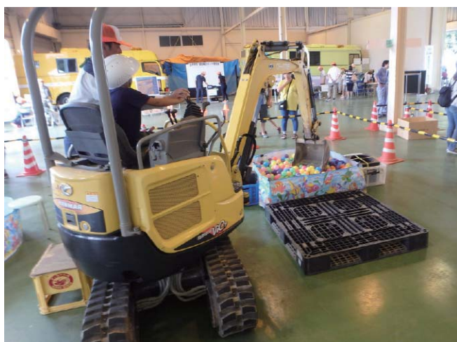
写-9 ミニショベル操作体験

今年は7月27日に開催し、13回目を迎えました。約500名の小学生や親子連れにお越し頂き、橋づくり工作体験やセメント工作体験、高所作業車・キャリアダンプ乗車体験、また同時開催として公益社団法人土木学会の「土木工事で使われるロボット展」も行われ、大変盛況に執り行われました。（写-9・10・11）