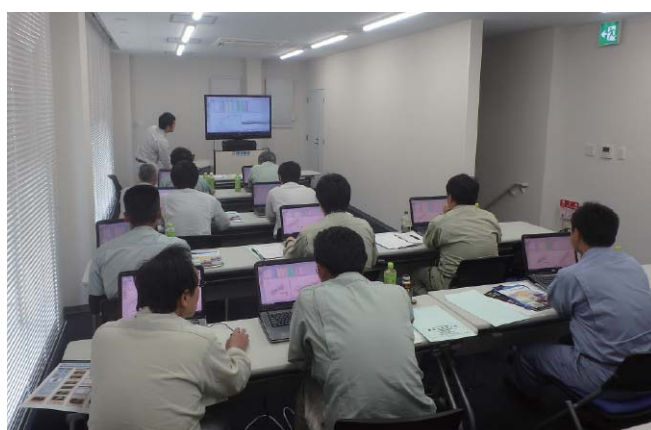
写－8 実技講習会（3次元設計データ作成）