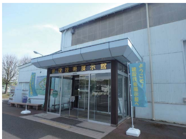
写-1 建設技術展示館