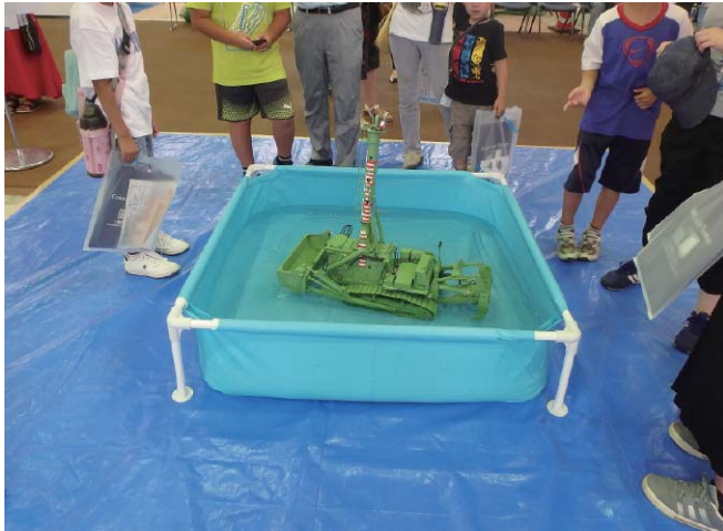
写- 11 水陸両用ブルドーザのラジコン体験