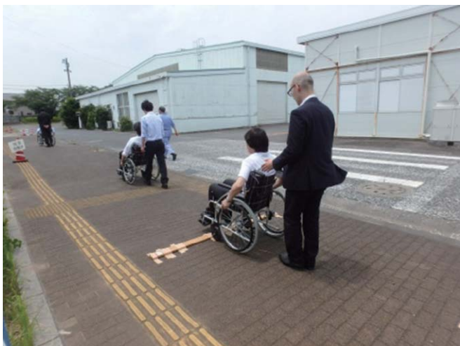
写- 12 バリアフリー体験（車いす）

車いすでは段差板 2 cm と 1 cm を使いその違いを体感した後、バリアフリー歩道と障害物のある歩道を自力で走行して比較して頂くことで、その大変さを実感して頂いています。(写- 12)