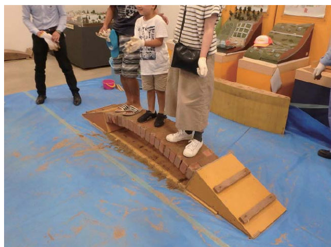
写-10 アーチ橋づくり体験