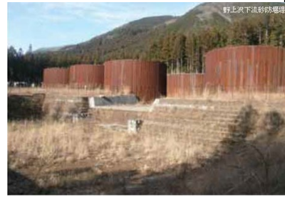
野上谷川下游防砂壩

由於男體山噴發造成火山堆積物厚重沉積地質撐不起一般的混凝土防砂壩，所以野上谷川下游採用的是鋼筒加鋼板樁打底的鋼製防砂壩。直線型鋼板樁嵌入圓筒鋼後再灌土填滿，成為防砂壩的本體。又因為當地土質黏度高，不適合用來充填，所以選用的是日向防砂壩堆積的砂質土壤。