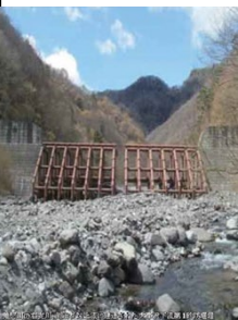
Barrage Ogotosawa Karyu Sabo n° 1

Le cours d'eau Ogoto, qui coule au nord du mont Nyohō et est placée comme affluent droit de la rivière Kinugawa, est un ruisseau de montagne avec un écoulement extrêmement intense du sol. Les affluents de la rivière Kinugawa ont un terrain escarpé, formé de fragiles caractéristiques géologiques provenant des effets des sources chaudes. Il se produit des éboulements de grandes quantités de terre lorsque des inondations se produisent en raison de typhons et d'autres causes, parce qu'un effondrement majeur continue de progresser sur le versant de la montagne. Les travaux de sabo ont commencé en 1952 pour éviter cela. Actuellement, 49 barrages sabō sont maintenus dans le bassin de la rivière Kinugawa.