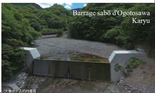
Barrage sabō d'Ogotosawa Karyu