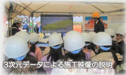
3次元データによる施工映像の説明