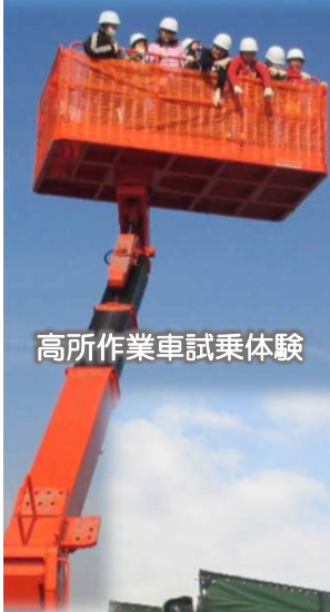
高所作業車試乗体験

北首都国道事務所では、国道4号の交通混雑の緩和や産業団地などの東埼玉道路沿線の開発を支援することを目的に、東埼玉道路の事業を推進しています。