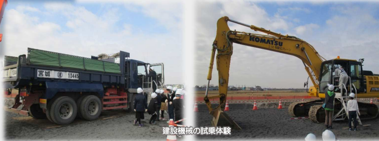
建設機械の試乗体験

開催日：令和2年1月24日（金） 場所：埼玉県北葛飾郡松伏町 大川戸地先 参加者：松伏町立金杉小学校 3年生 27名 4年生 28名