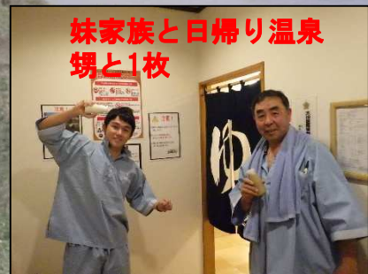
妹家族と日帰り温泉 甥と1枚