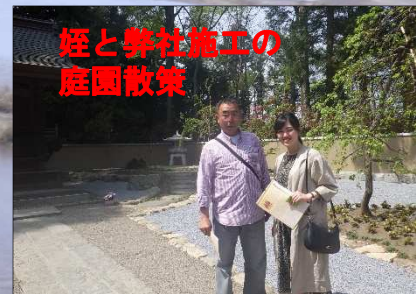
姪と弊社施工の庭園散策