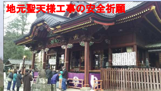
地元聖天様工事の安全祈願