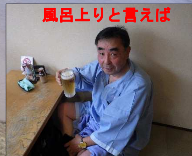
風呂上りと言えば