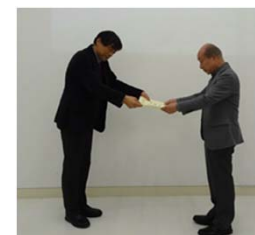
東京デザイン専門学校への感謝状授与式