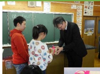
2月5日 (水) 環境委員会の 児童代表から返納