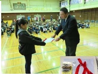
1月28日 (火) 環境飼育委員会の 児童代表から返納