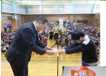
1月21日 (火) 環境栽培委員会の 児童代表から返納