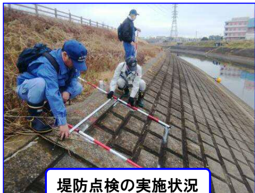
堤防点検の実施状況

今年度より毎年出水期前（5月頃）に行っていた堤防点検をより効率的かつ効果的に実施するため前年の秋から冬に行うこととなりました。そのため2/3、2/5、2/17の3日間で松戸出張所管内の堤防を徒歩で点検しました。点検の結果、一部坂川の護岸に損傷が大きい箇所があったので、出水期前までに補修予定です。