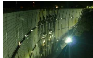
川治ダムのライトアップによる誘客