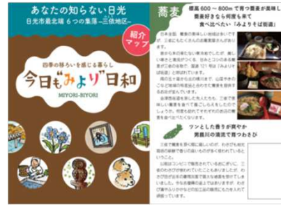
三依地区の情報マップ作成