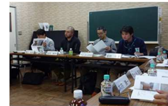
地元ツアー会社・鉄道事業者・ダム愛好家らとの意見交換