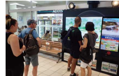
多言語化によるダム情報の発信