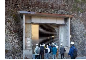
川俣ダムと川俣発電所の見学ツアーの展開