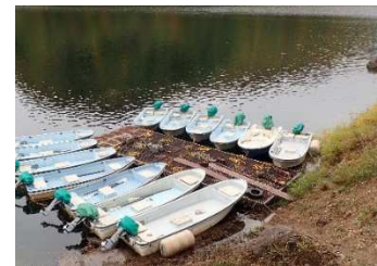
川俣湖における水面利用ルールの作成