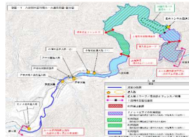
八汐湖水面利用ルールの運用