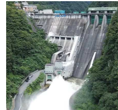
五十里ダムの環境放流を活用した誘客