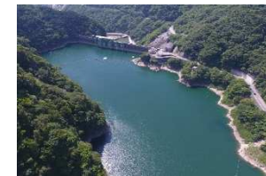
五十里湖における水面利用ルールの設定による水面の活用