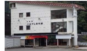
川治ダム資料館のリニューアルの実施