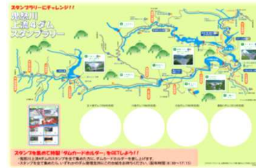
4ダム巡りスタンプラリーの実施