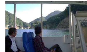
八汐湖における水陸両用バスの運行