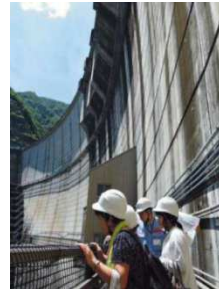
上下流交流の推進