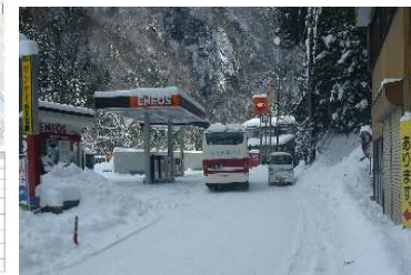
日向地区の県道の改築