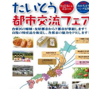
情報マップを活用した下流域との交流展開