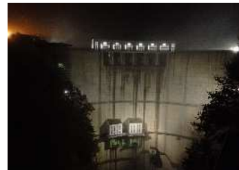
川俣ダムと星空観察のツアー実施