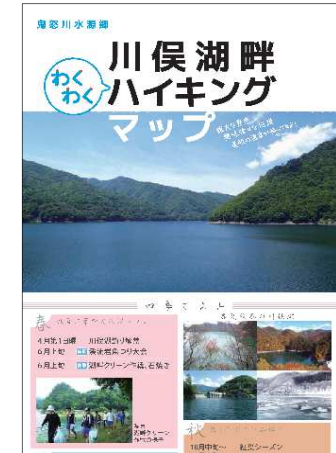
川俣地区における情報マップ