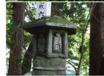
日向地区における地域資源を活かした情報発信の実施