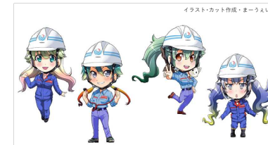
キャラクターを活用したダムのブランド化

川治地区(五十里ダム・川治ダム関連地区) ダム見学ツアーを軸として地域活性化を図る