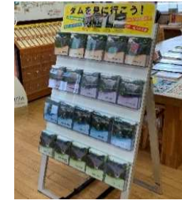
多言語化によるダム情報の提供