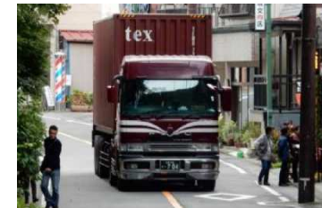
川治地区のバイパス化による安全確保