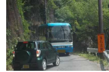
川俣地区の県道の改築