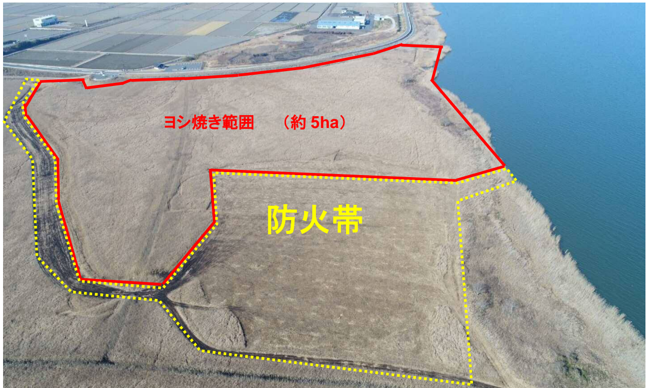
昨年（平成31年3月3日）のヨシ焼き状況