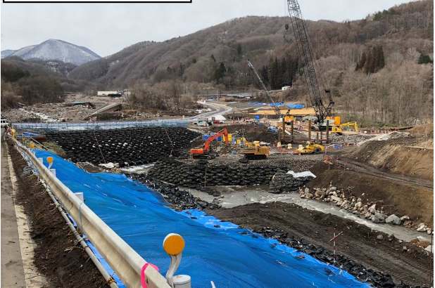
杭基礎工施工状況①